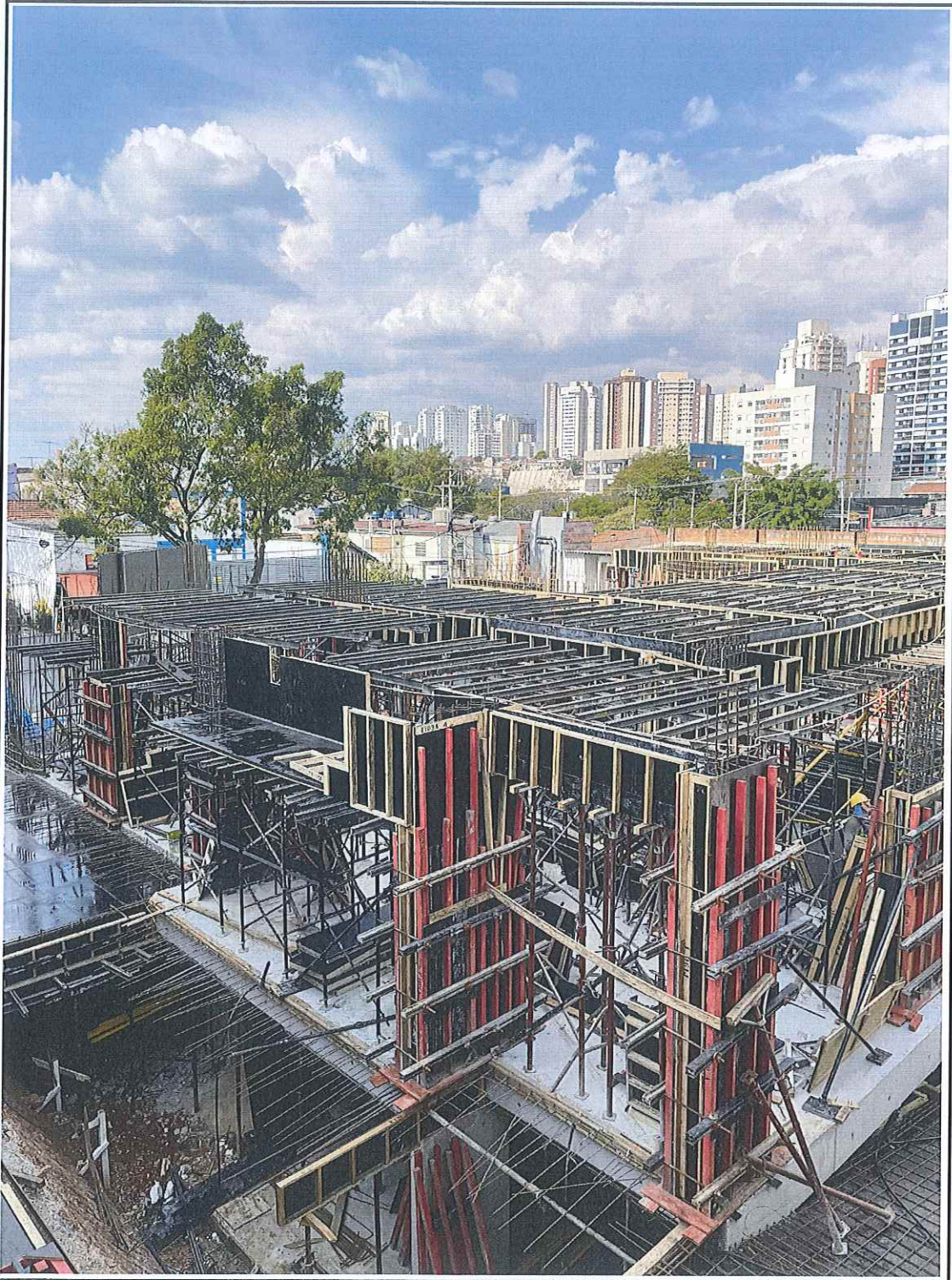
Montagem da forma para concretagem da laje do térreo.