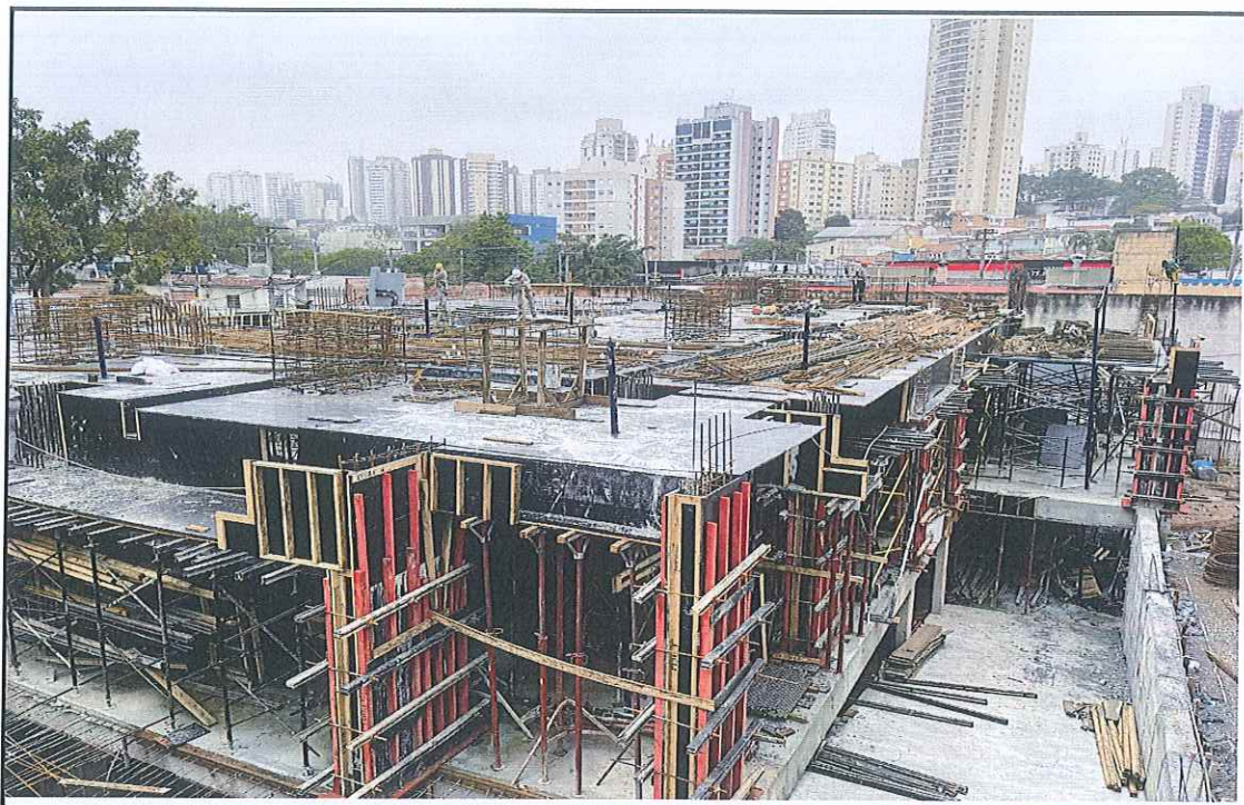
Montagem da armação da laje do térreo.