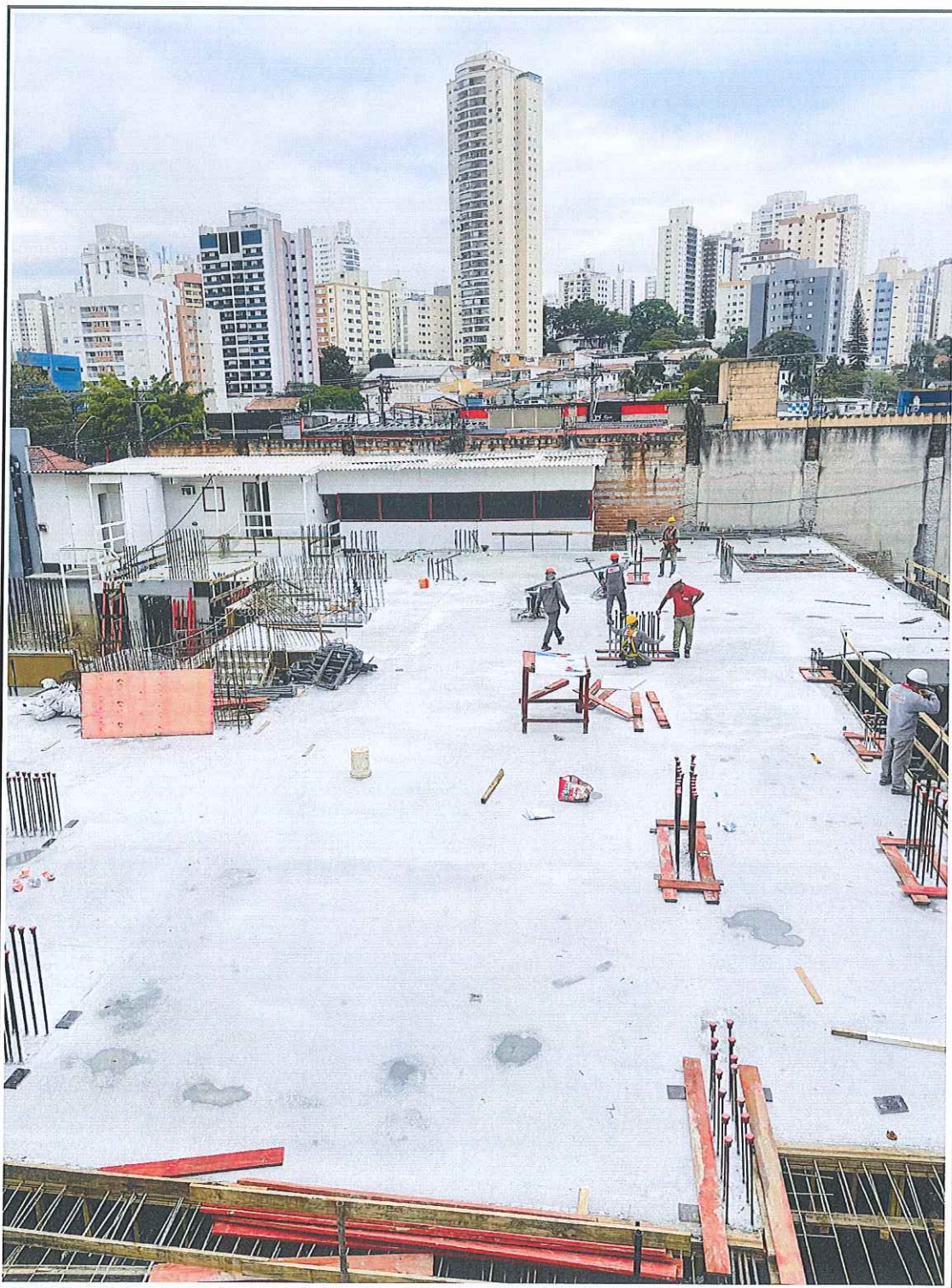
Início da execução da forma dos pilares do 1º sub-solo.