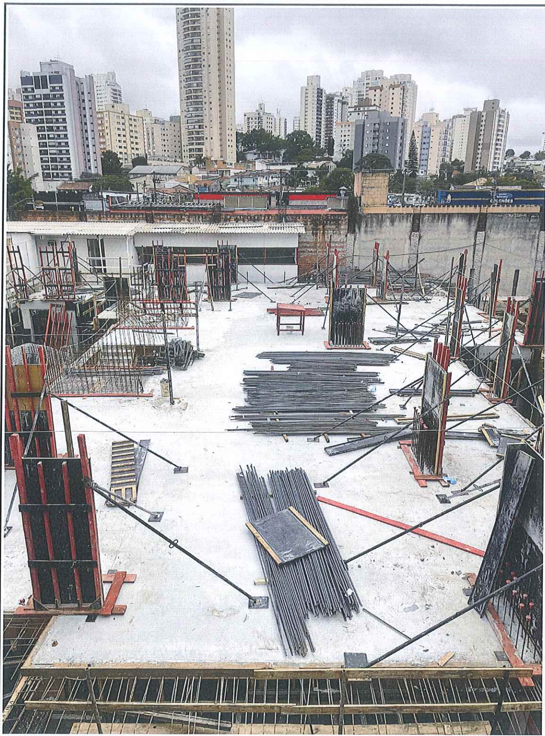
Forma e armação dos pilares do 1º sub-solo.