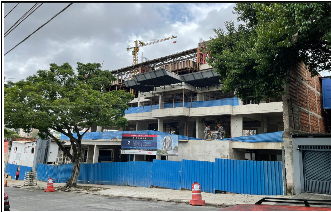
Vista da obra - Rua Dom Bernardo Nogueira