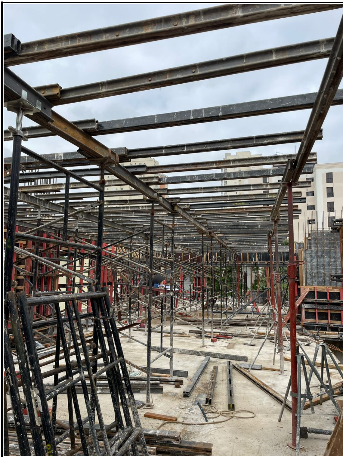
Montagem do escoramento da laje do 4º pavimento.