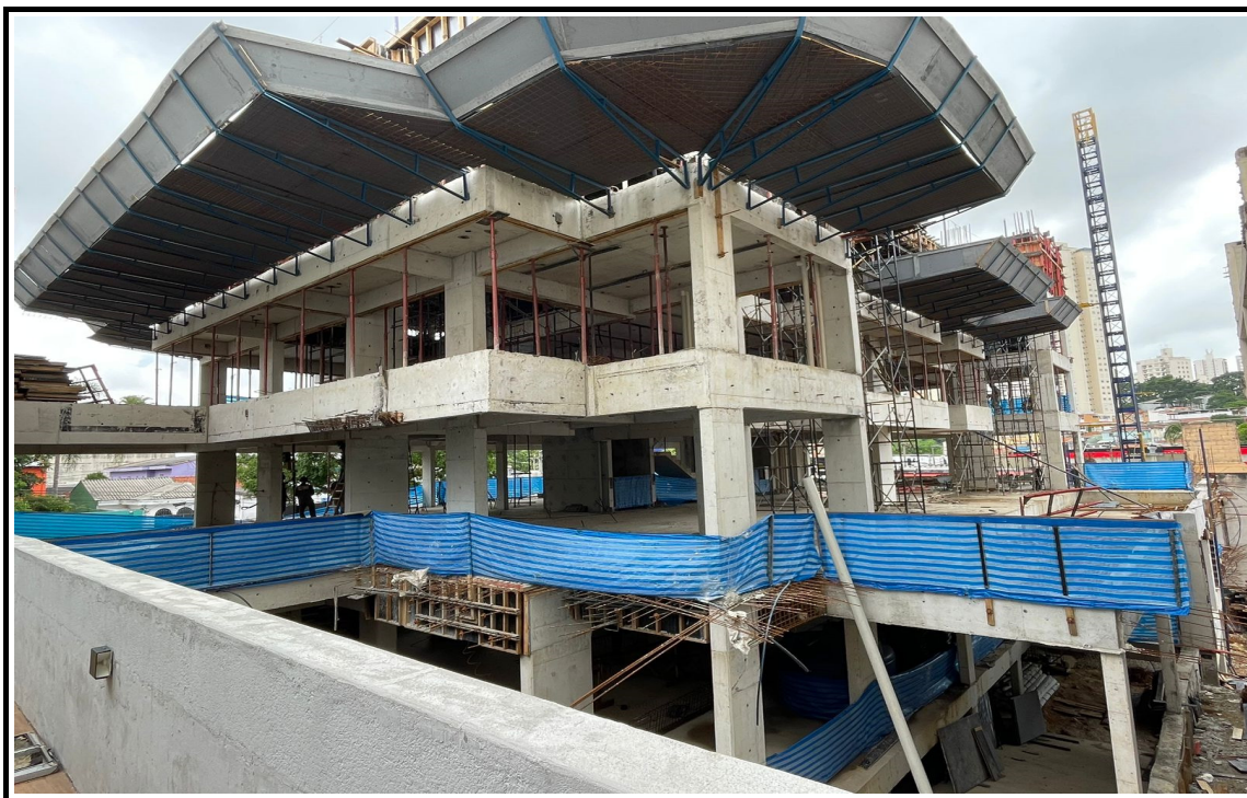
Vista obra - Rua Santo Irineu