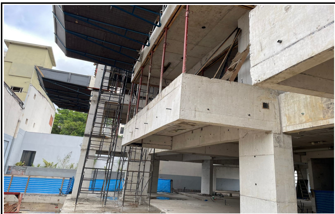
Lateral da obra - Bandeja de proteção primária