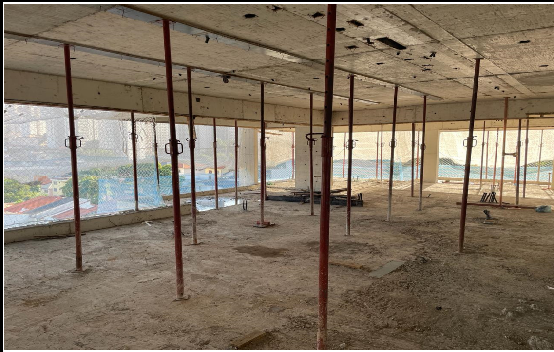
Laje escorada aguardando a cura final do concreto.