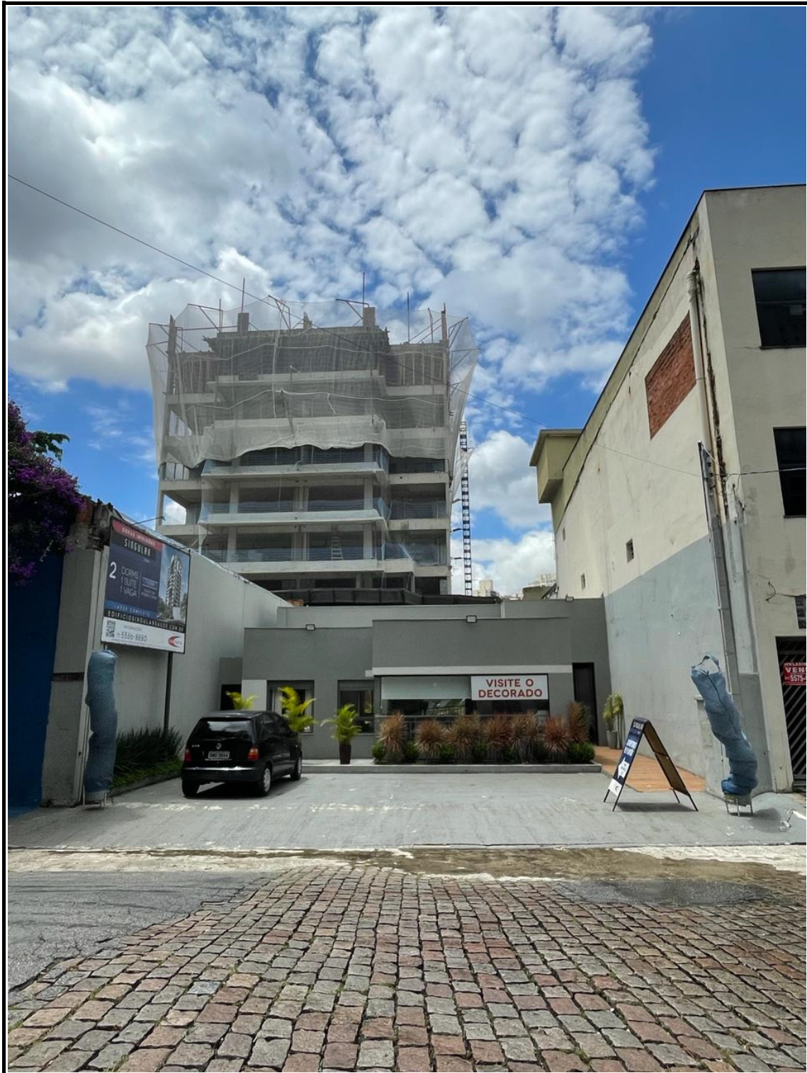
Vista obra Rua Santo Irineu.