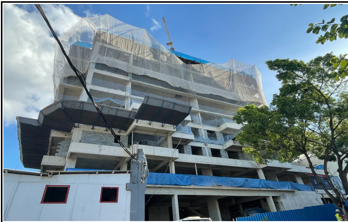
Vista obra Rua Dom Bernardo.