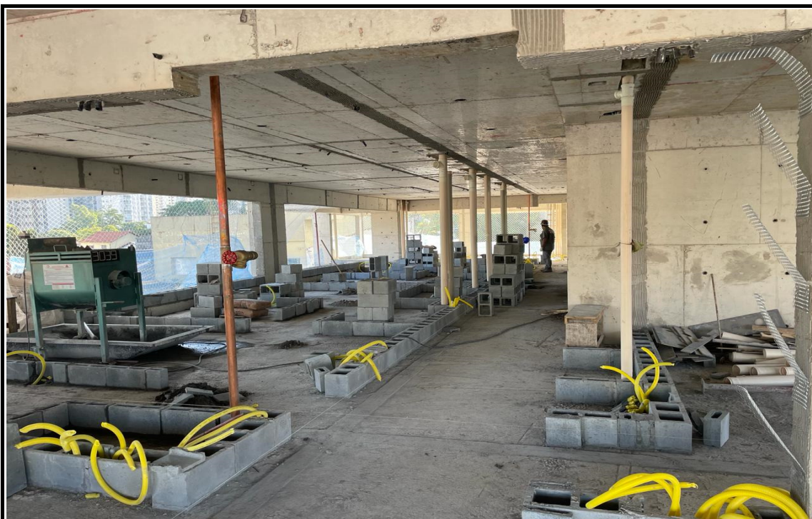
Execução de alvenaria.