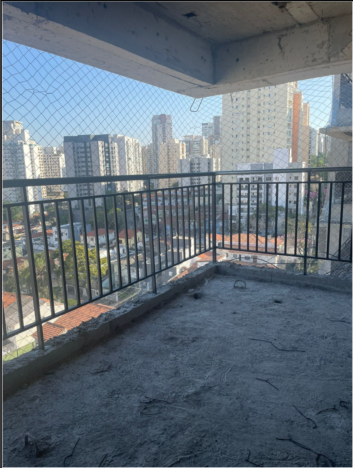
Instalação de guarda-corpo nas sacadas.