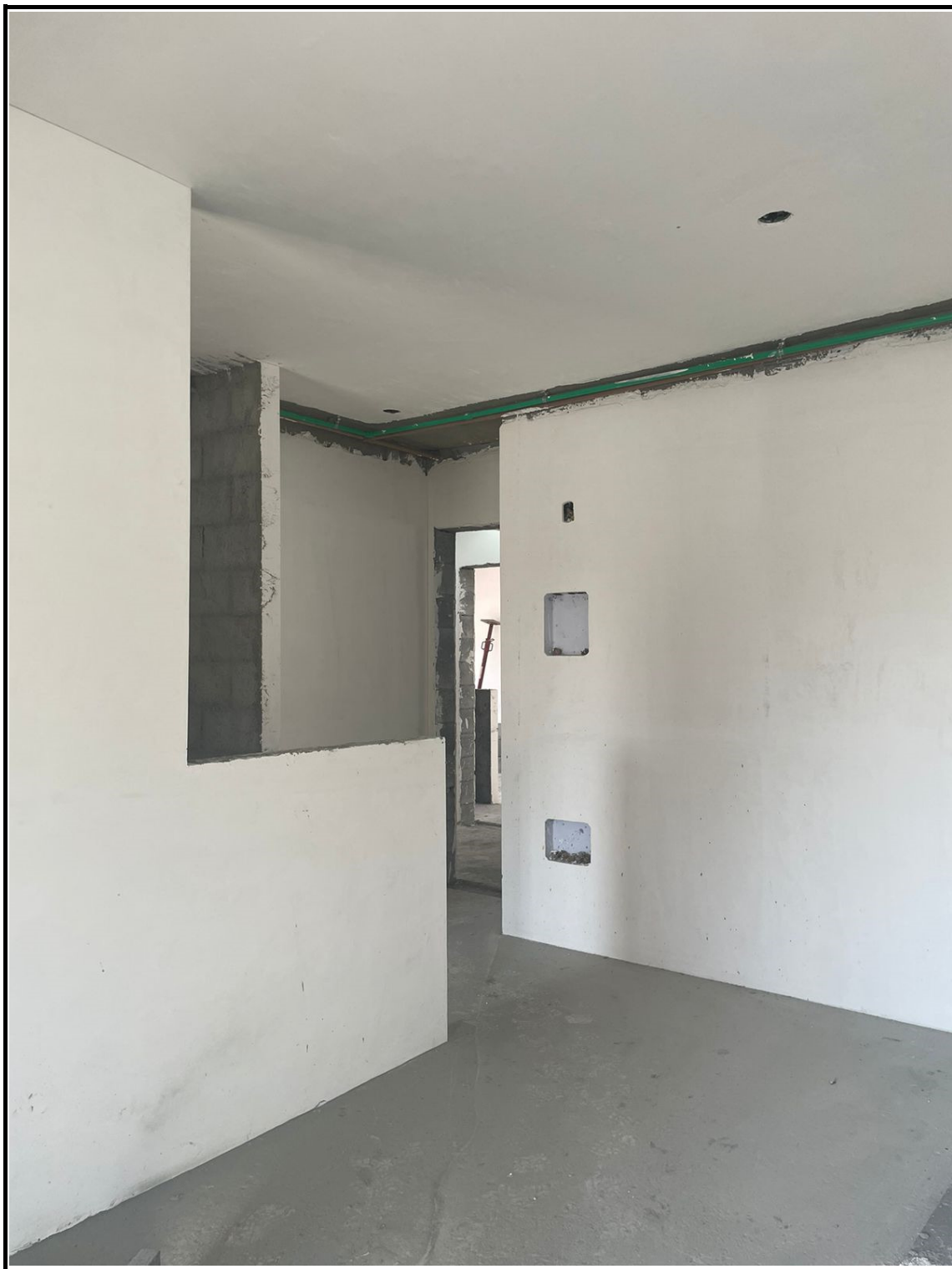
Execução de gesso liso e contra-piso cimentado.