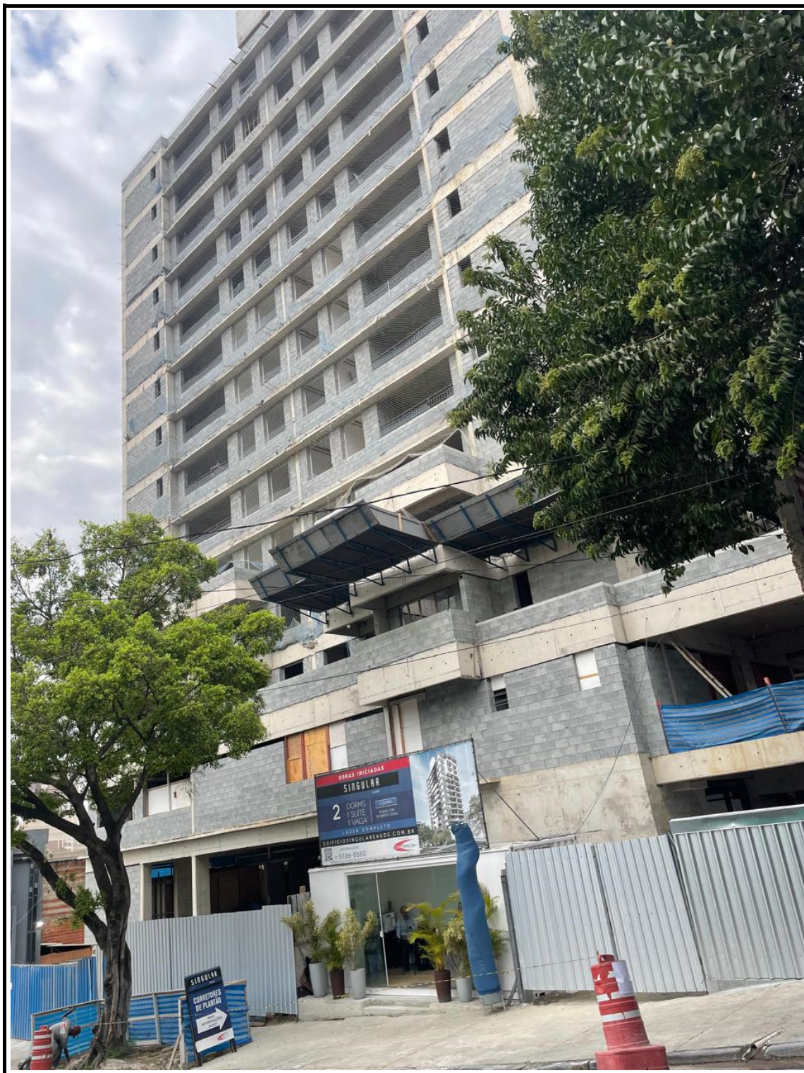
Vista obra Rua Dom Bernardo