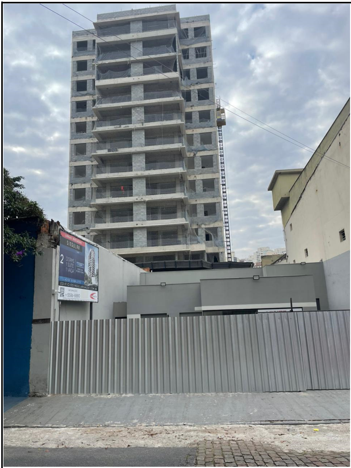
Vista obra Rua Santo Irineu.