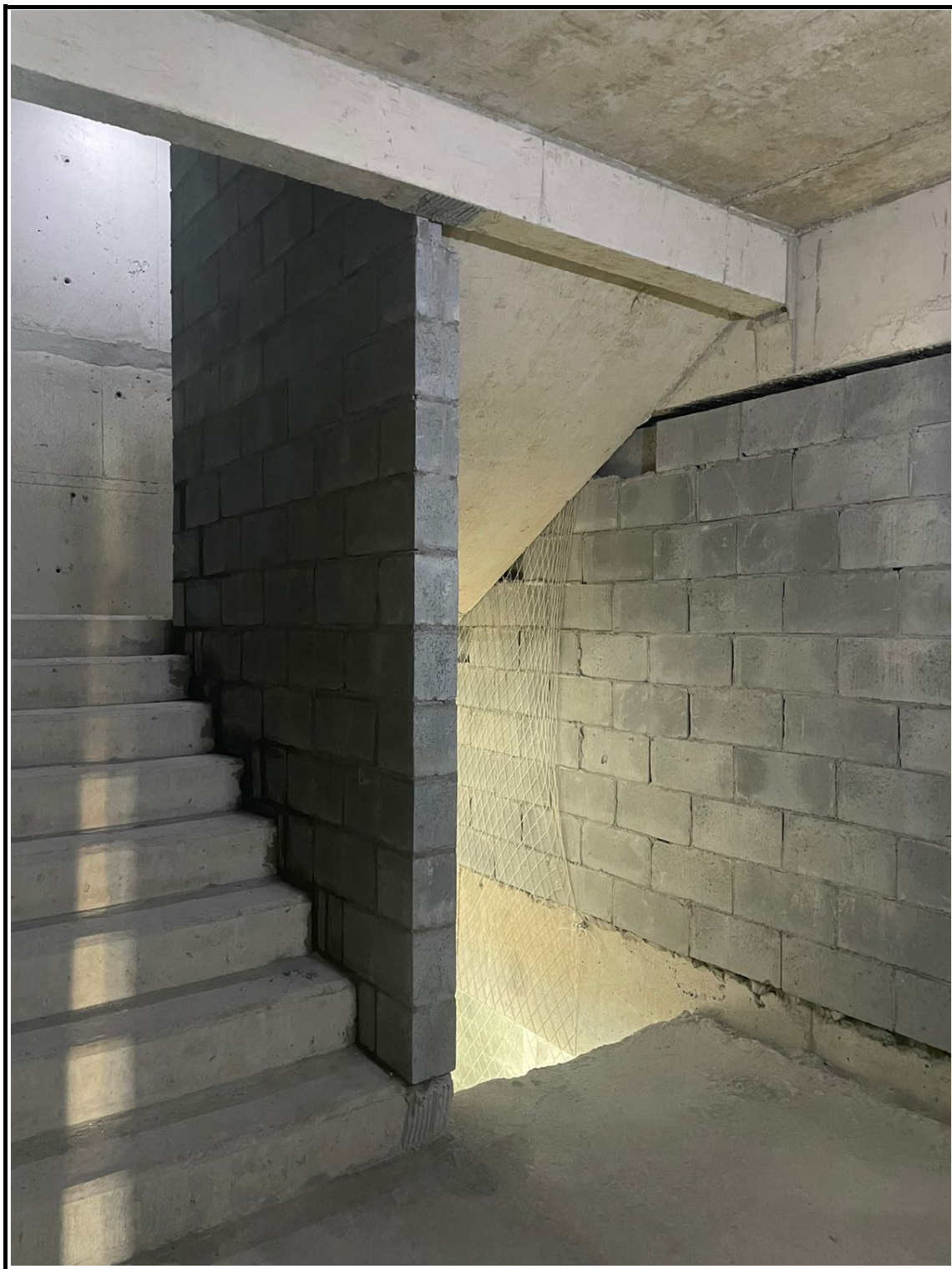
Alvenaria de fechamento das escadas.