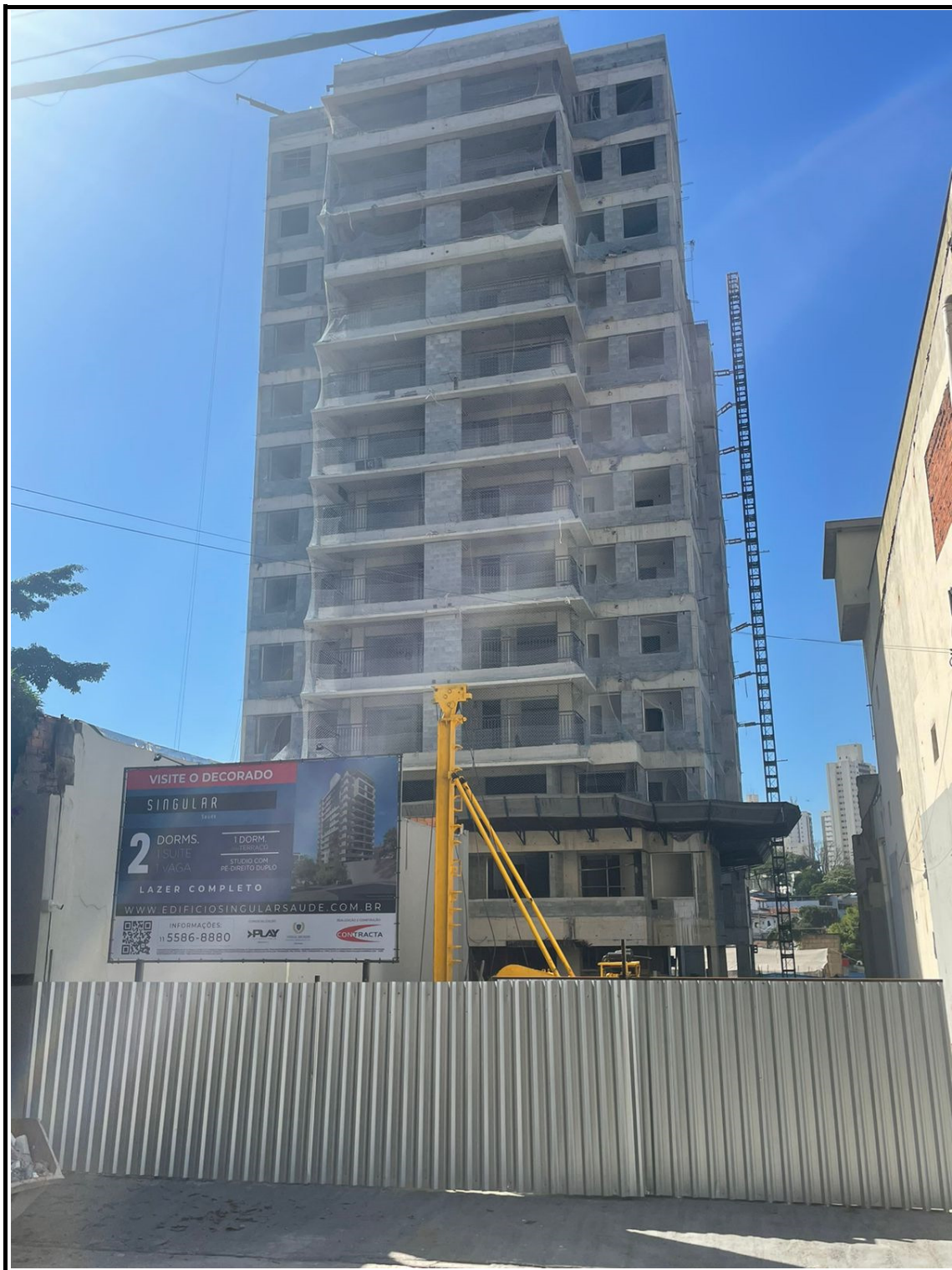
Vista obra Rua Santo Irineu.