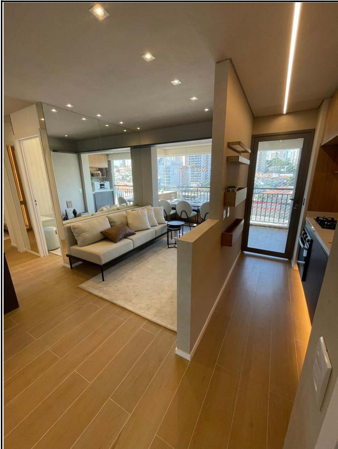
Apartamento decorado no 4º andar.