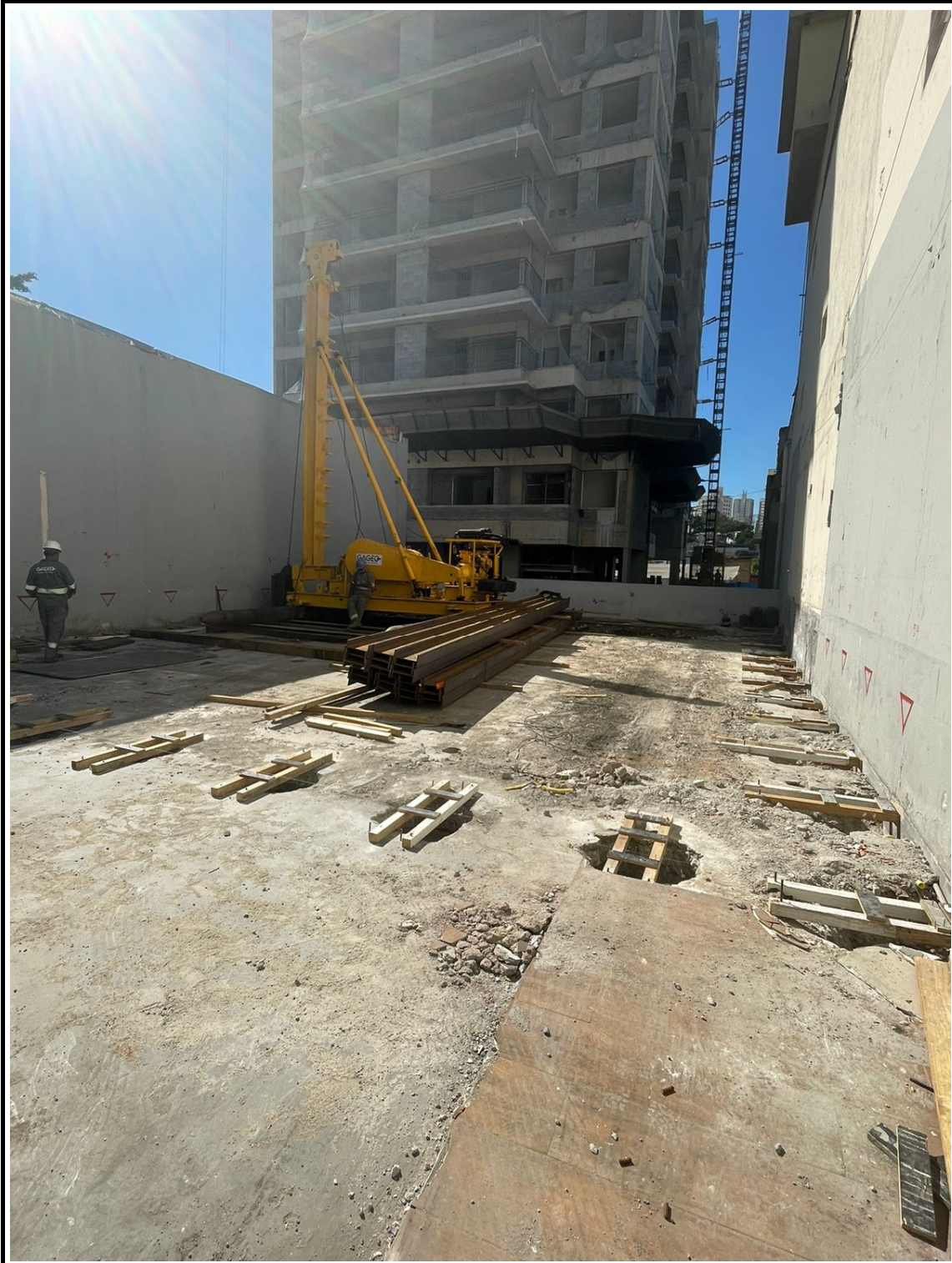
Cravação de perfil metálico - contenção vizinhos na área do antigo stand de vendas.