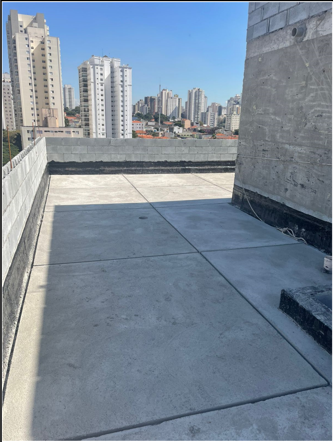
Impermeabilização e revestimento na cobertura / ático.