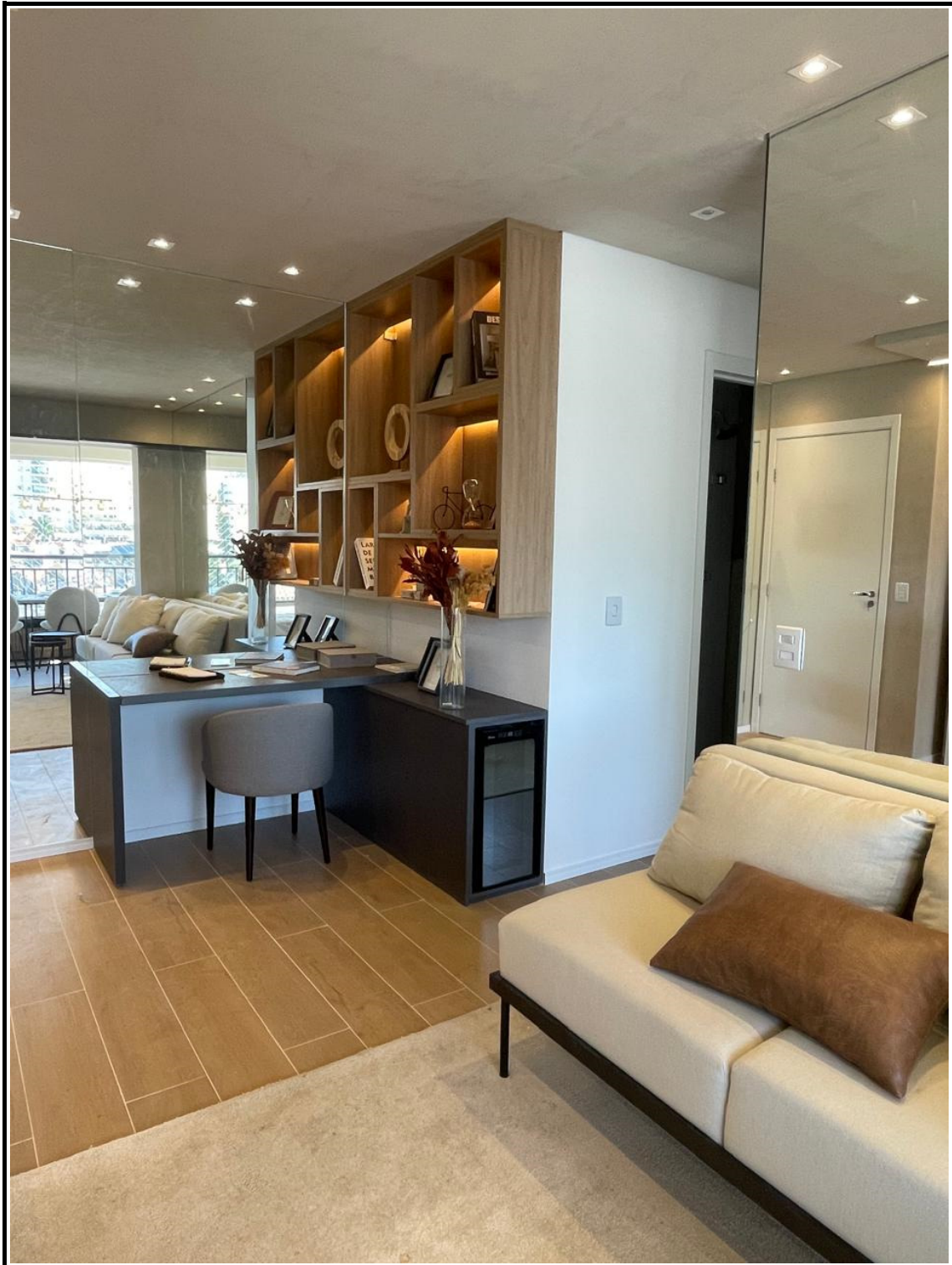
Apartamento decorado no 4º andar.