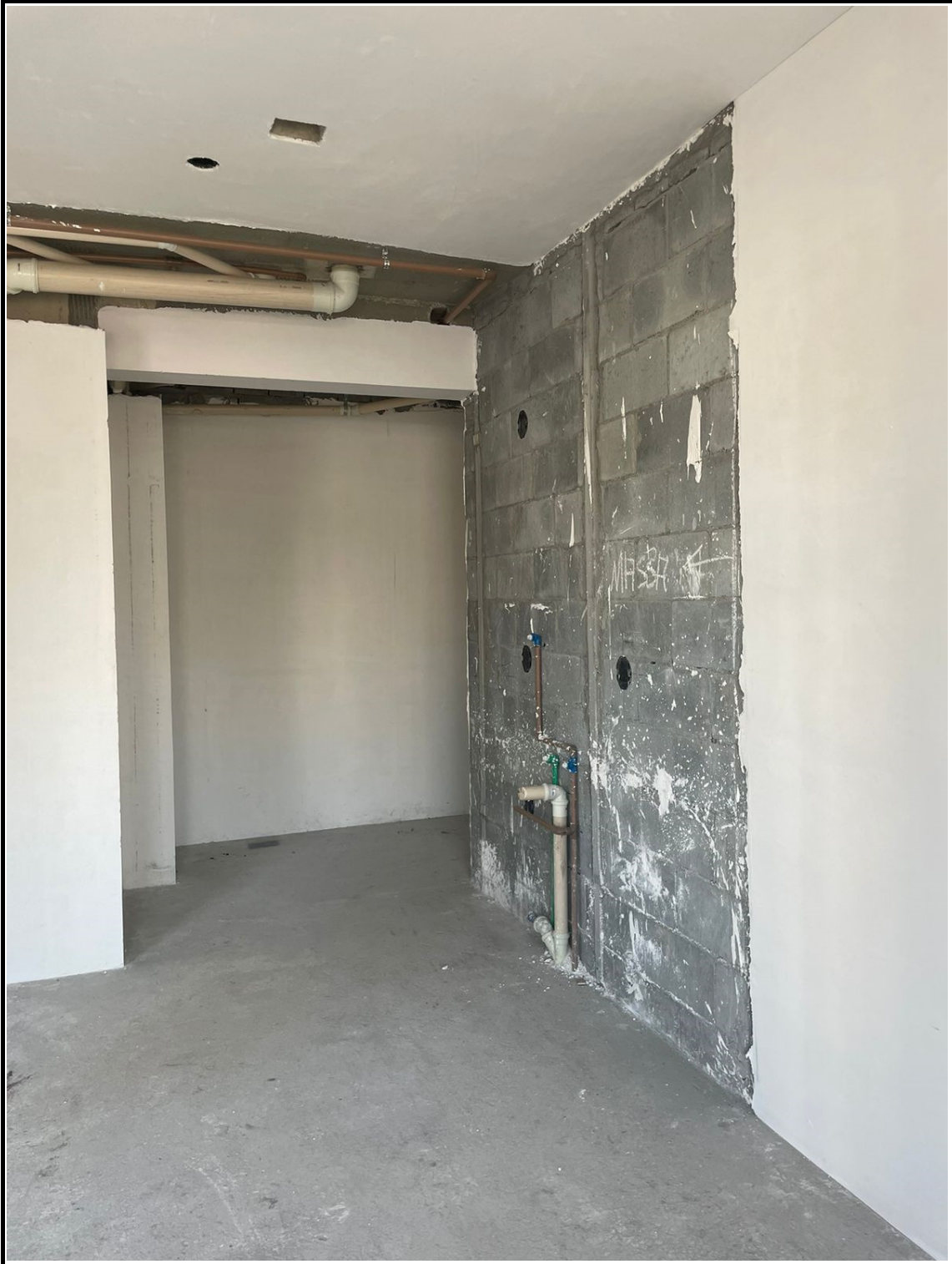
Execução de gesso liso, contra-piso cimentado e instalações hidráulicas.