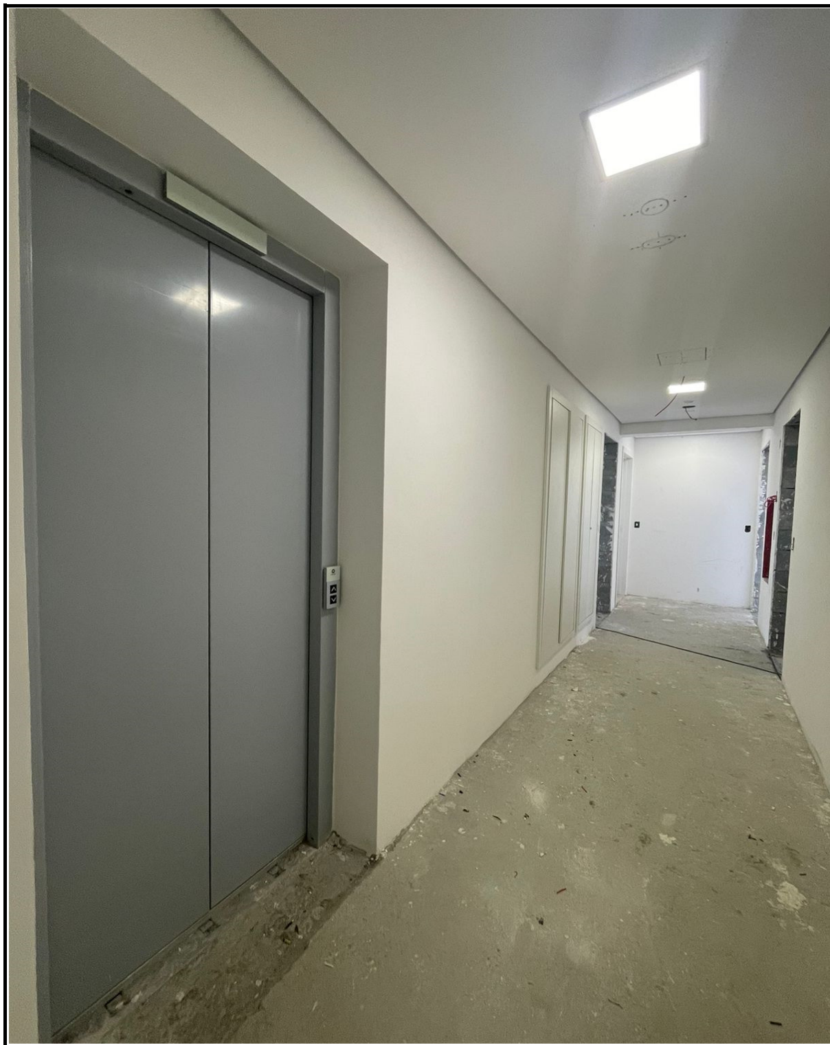
Forro de gesso, iluminação e elevador concluído no hall dos andares.