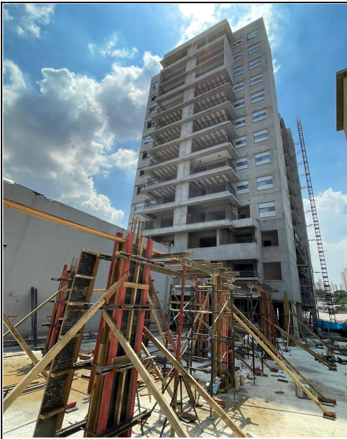
Fachada Santo Irineu / Execução de estrutura para loja, portaria, vestiários, bicicletário e delivery.