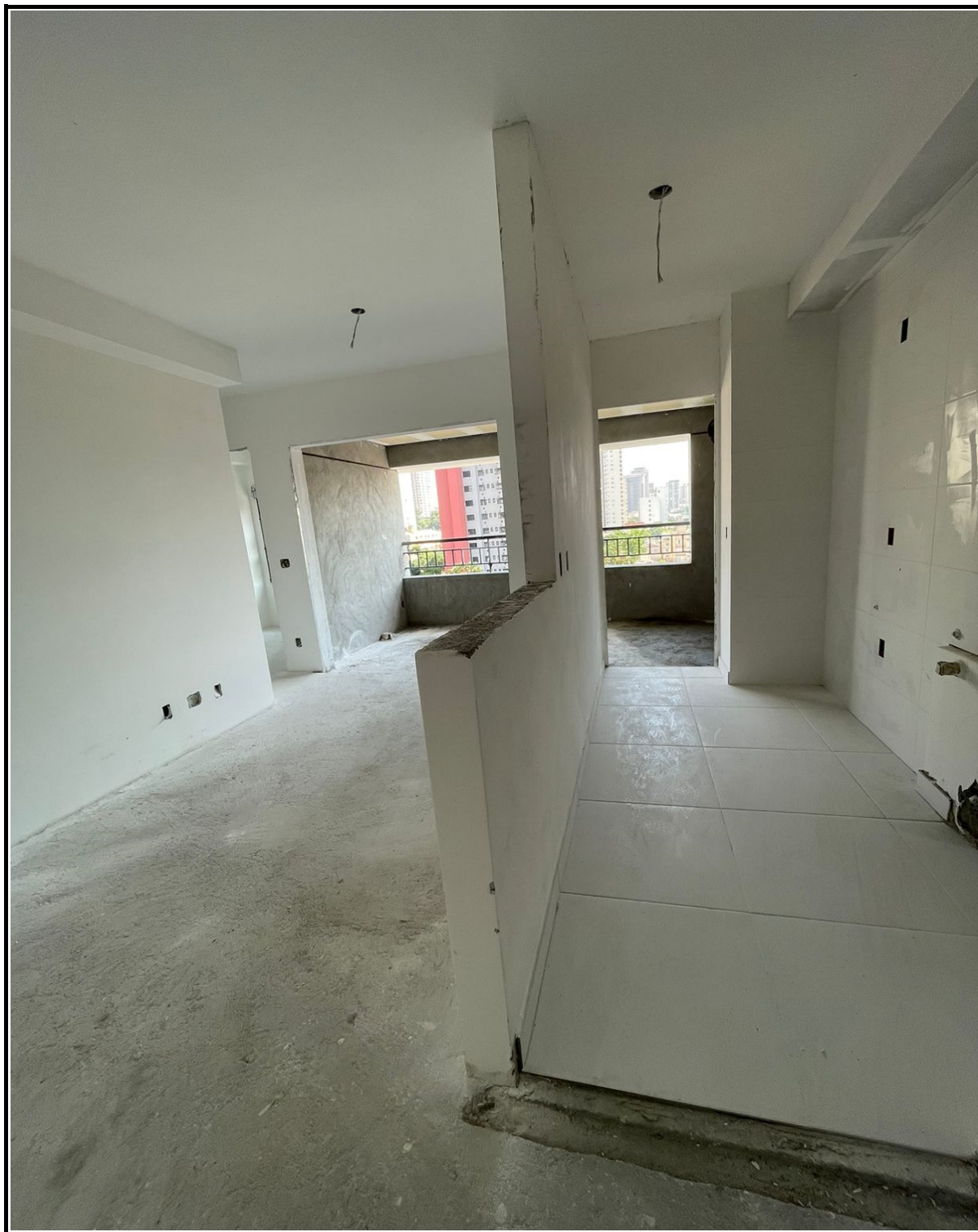
Pintura e revestimento cerâmico nos apartamentos.