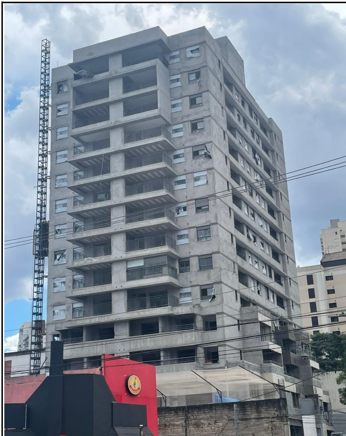
Execução de revestimento externo na fachada, instalação de gradil e caixilharia.