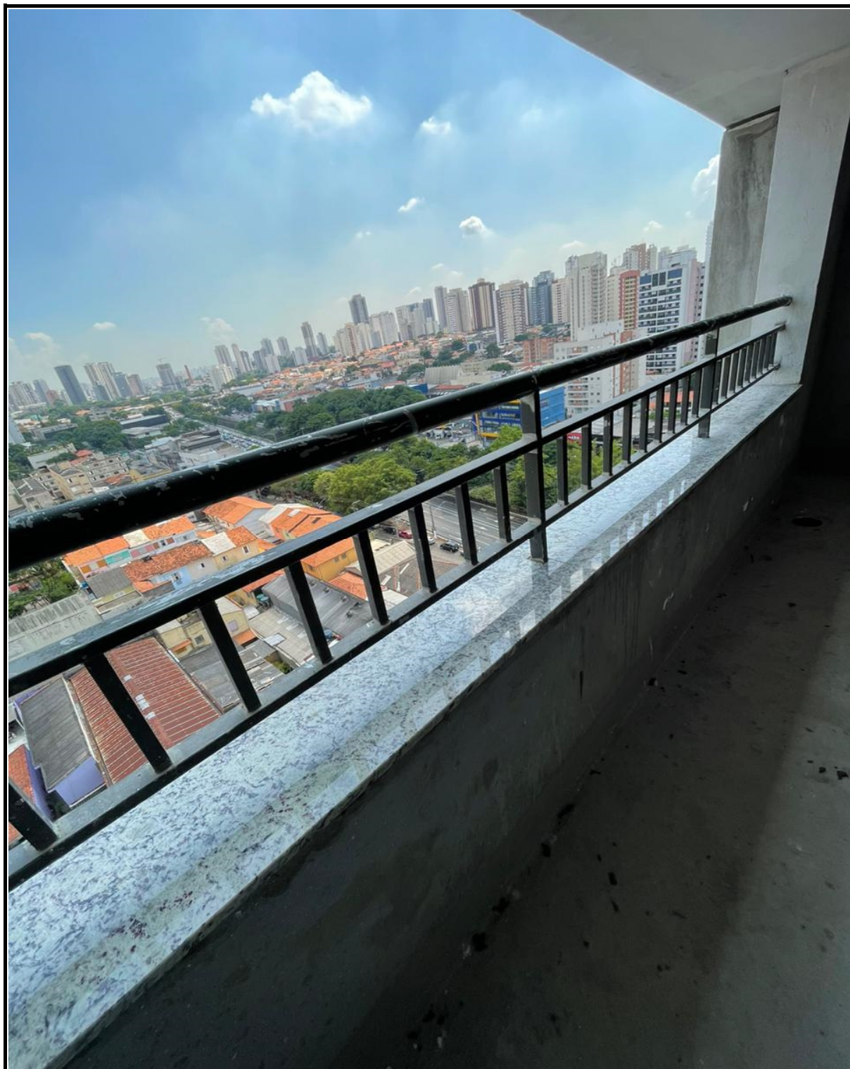
Instalação de gradil metálico e revestimento em granito.