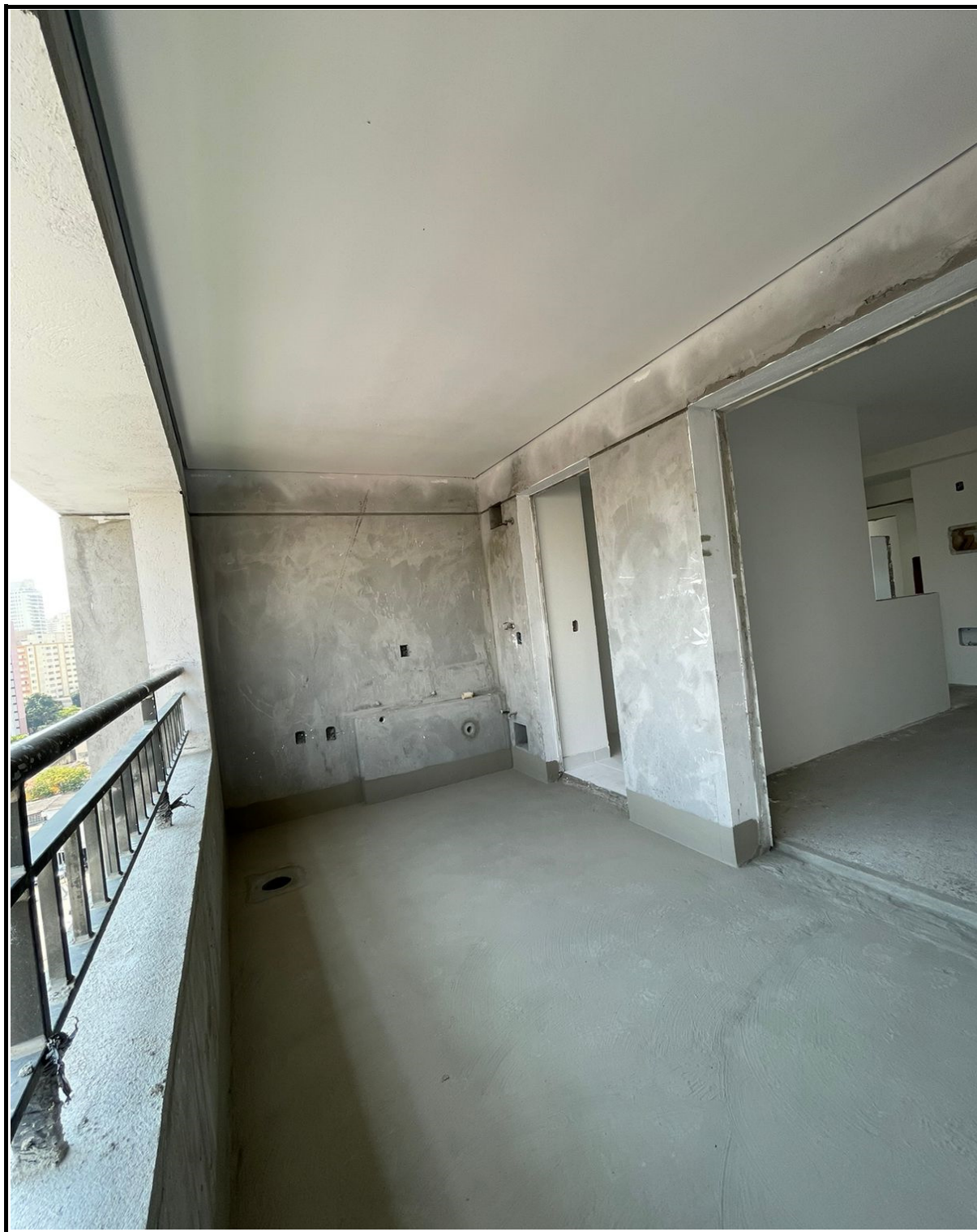
Execução de forro, massa e impermeabilização em sacadas.