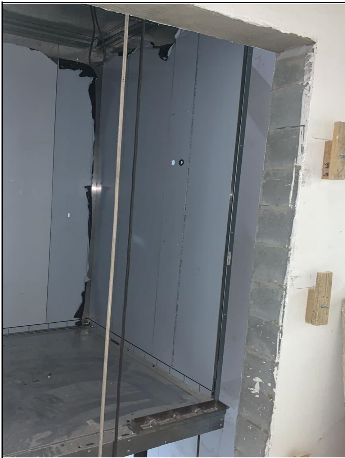
Instalação dos elevadores.