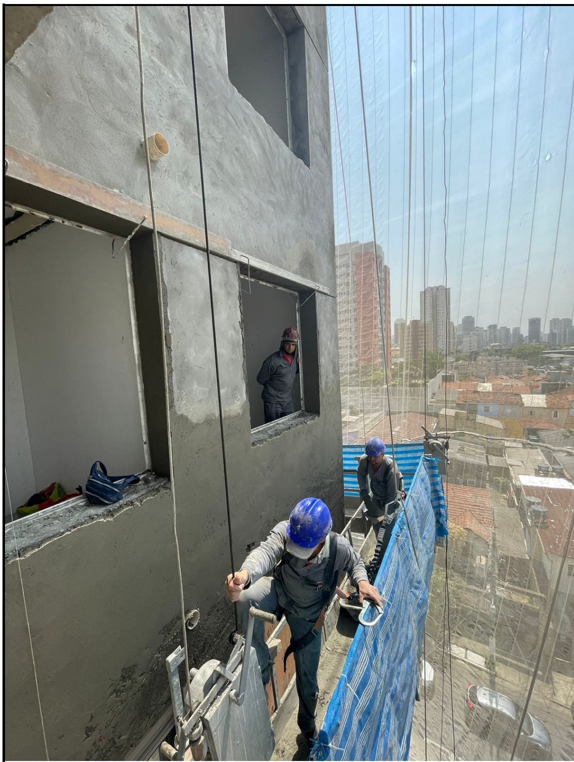
Execução de revestimento externo na fachada.