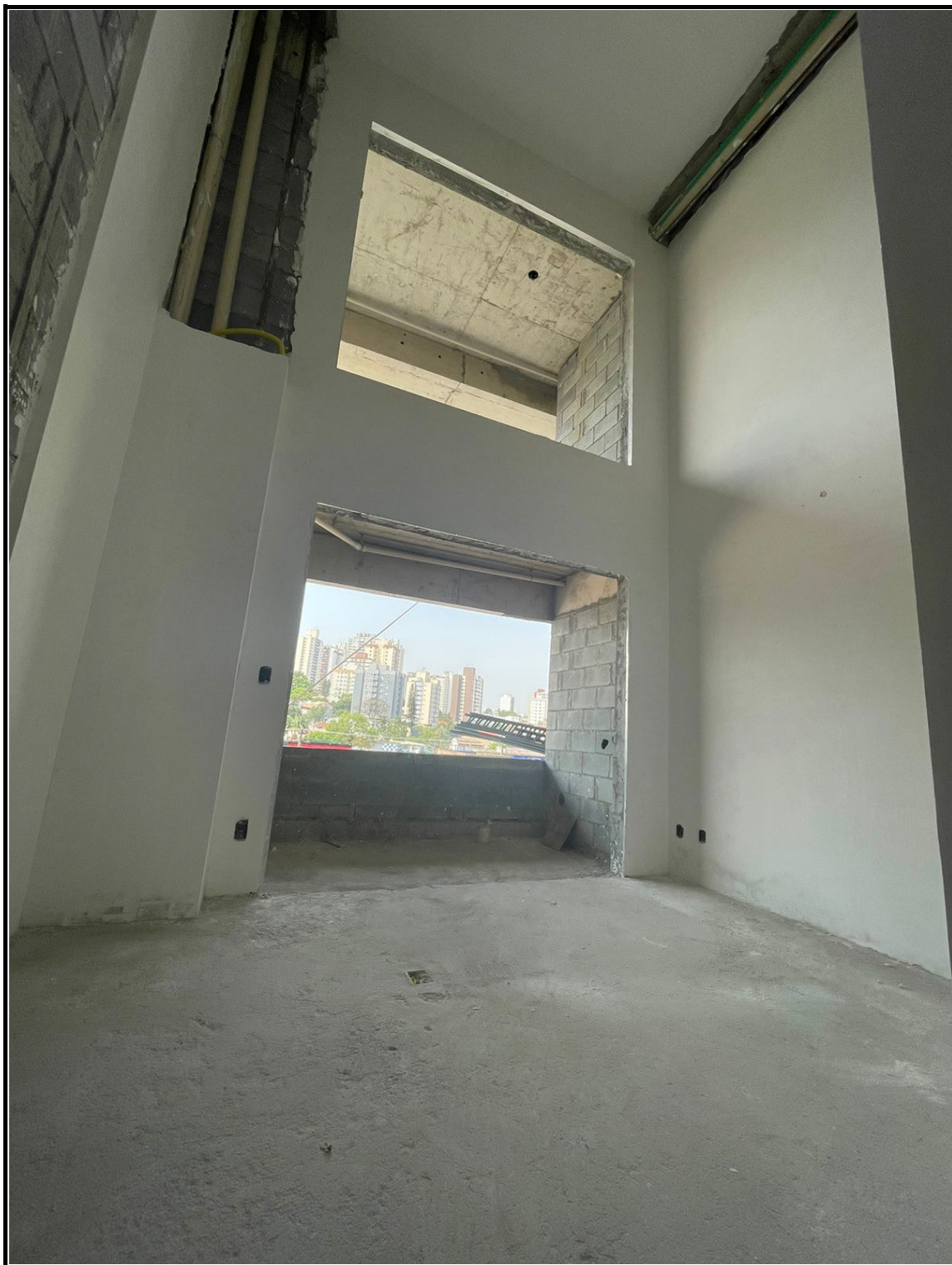
Revestimento em gesso, contra-piso e instalações hidráulicas em apartamento.