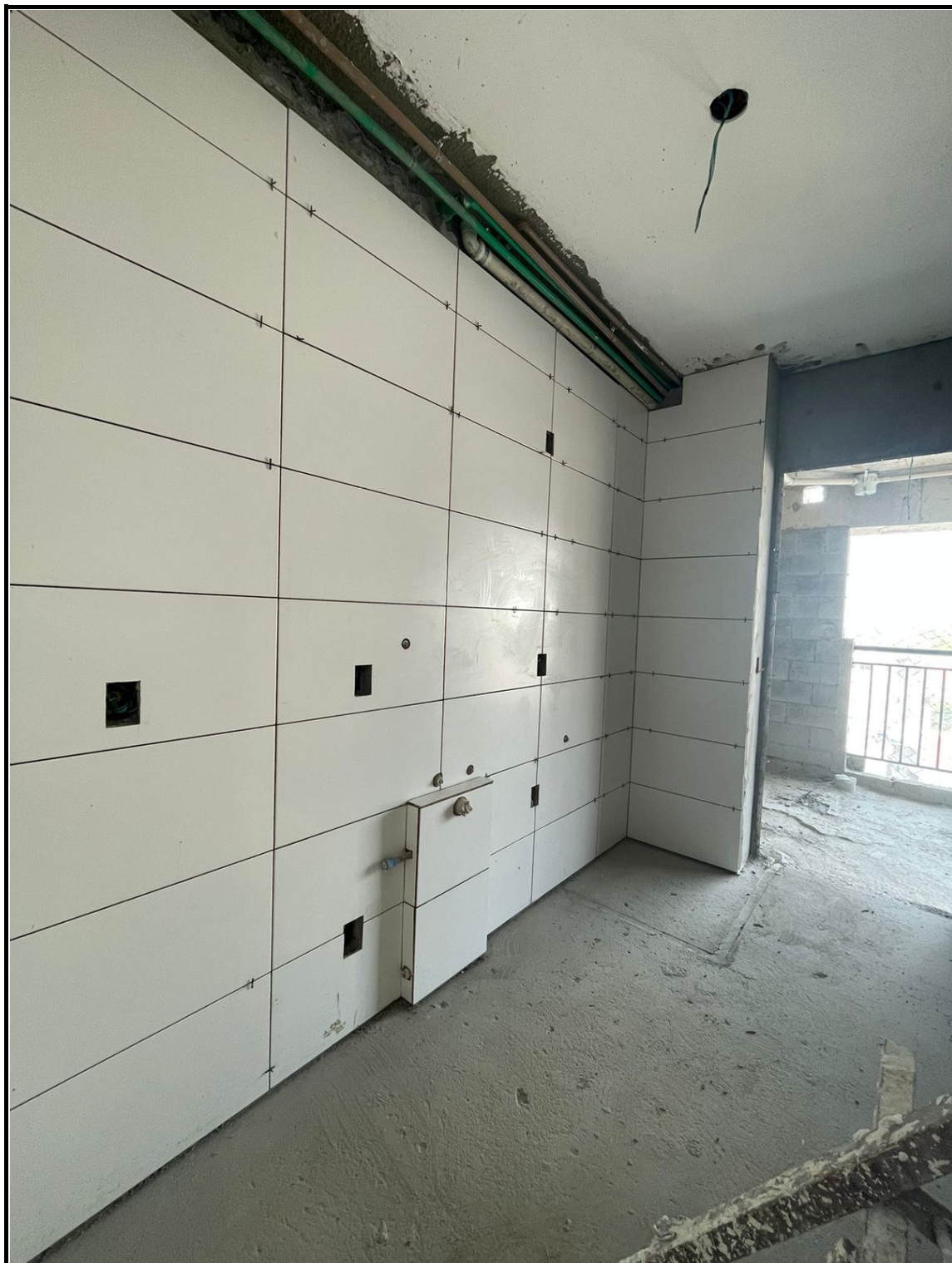
Revestimento cerâmico em cozinha.