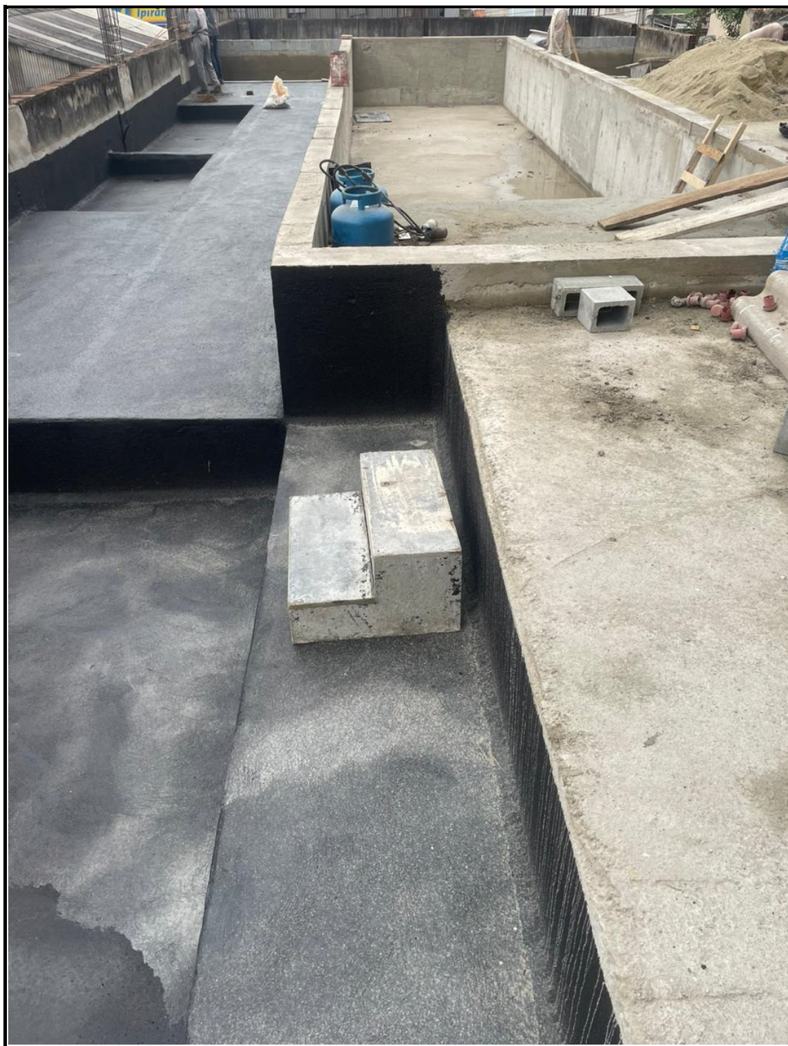
Impermeabilização de áreas comuns.