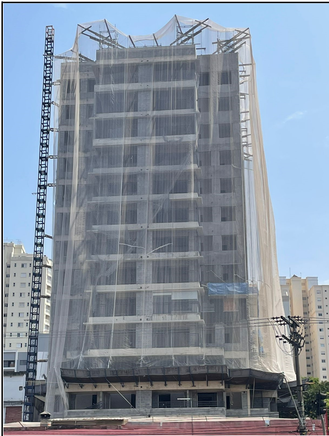
Fachada voltada para Avenida Ricardo Jafet.